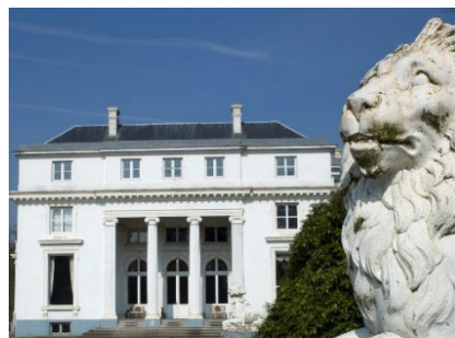
Hof ter Linden Edegem