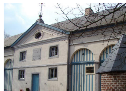
Domein Roosendael Sint Katelijne-Waver